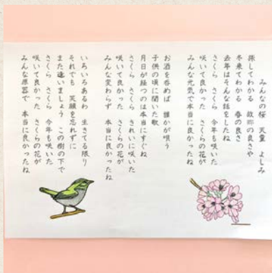
いくつもの色を重ねた塗り絵が素敵です