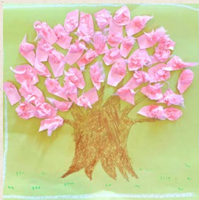
丸めたお花紙で立体感を出しました