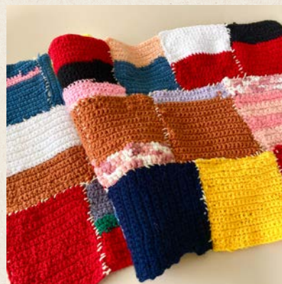
細編みで作った正方形をつないで、大きな布にしました