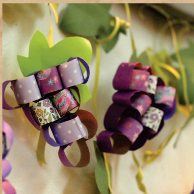
まるで本物のように蔓がのびた秋の味覚、ぶどうたち