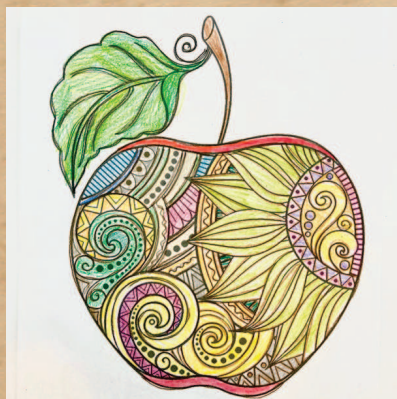
細かいところまで丁寧に色分けされています