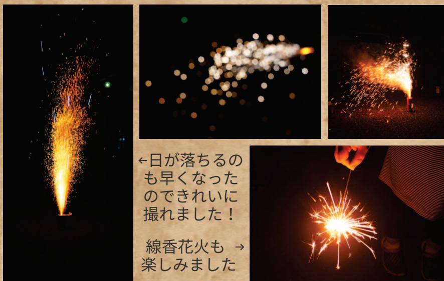
←日が落ちるの も早くなった のできれいに 撮れました！ 線香花火も → 楽しみました