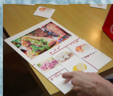
子供役のとが おつかいをして...