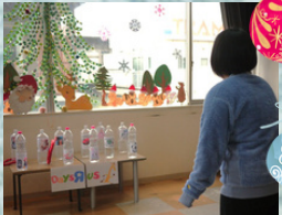
お母さんが子供の欲しい プレゼントをGET!